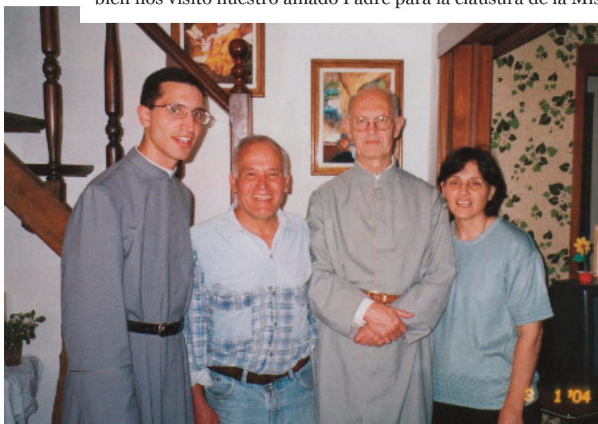
El P. Fundador y el P. Diego junto a los papás de éste.

En los años 2004, 2006 y 2009 tuvimos la gran alegría de recibir a nuestro Padre Fundador quien predicó los retiros de perseverancia en el Hogar de las Hermanas de los Ancianos Desamparados. Luego teníamos una convivencia en familia. También nos visitó nuestro amado Padre para la clausura de la Misión del año 2011.