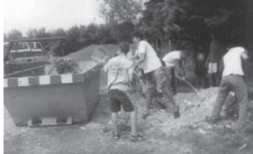
Chicos del grupo trabajando en el Instituto